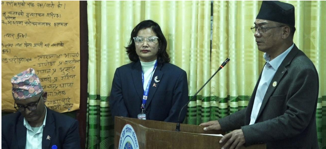
आर्थिक मामिला मन्त्रीज्यू मन्तव्य दिने क्रममा