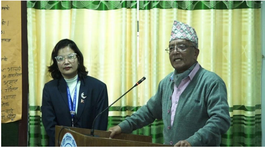
ट्रान्सपरेन्सी इन्टरनेशनल सम्बन्धी जानकारी दिने क्रममा