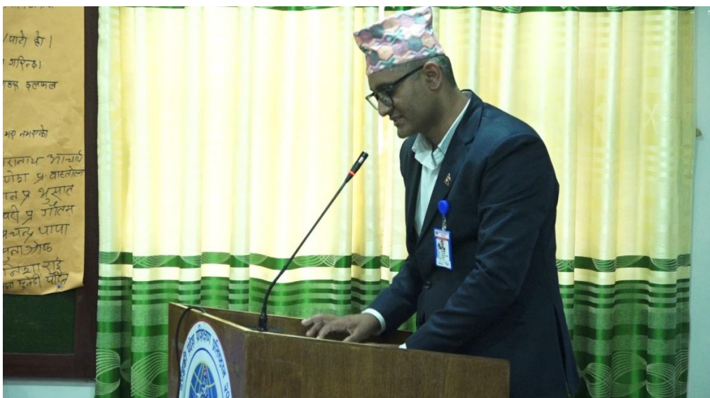
कार्यक्रम संचालनको क्रममा