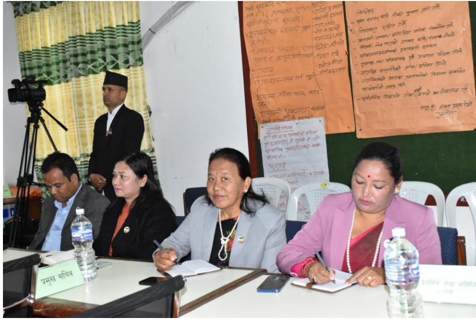
सार्वजनिक लेखा समितिका माननीय सदस्यज्यूहरु