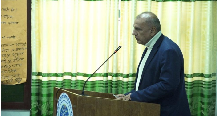
सुनास सम्बन्धी जानकारी गराउने क्रममा