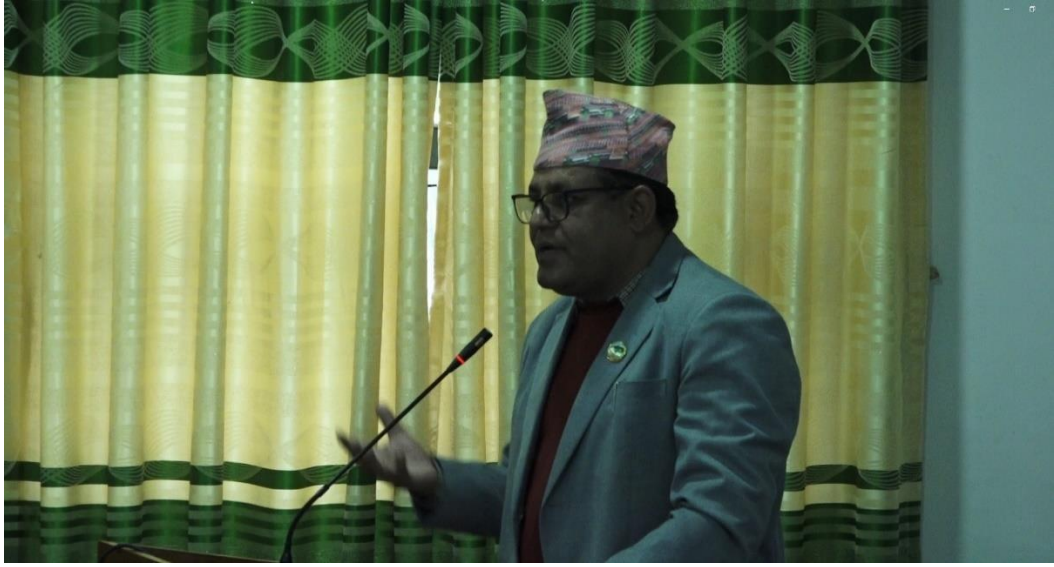
कार्यक्रमको उद्देश्य सम्बन्धी जानकारी दिने क्रममा