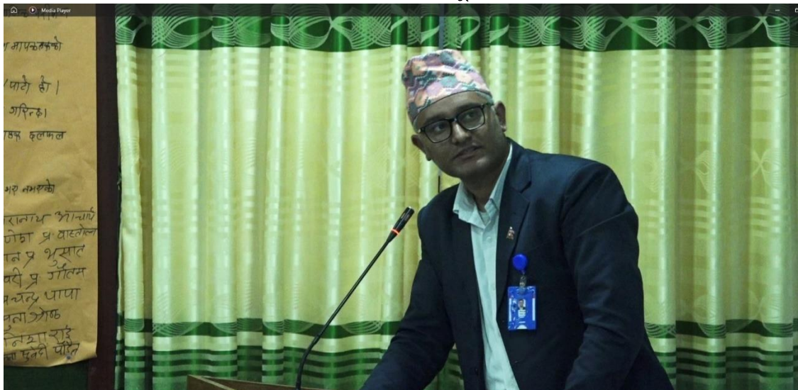
उपसचिव, गण्डकी प्रदेश सभा, कार्यक्रम सञ्चालनको क्रममा