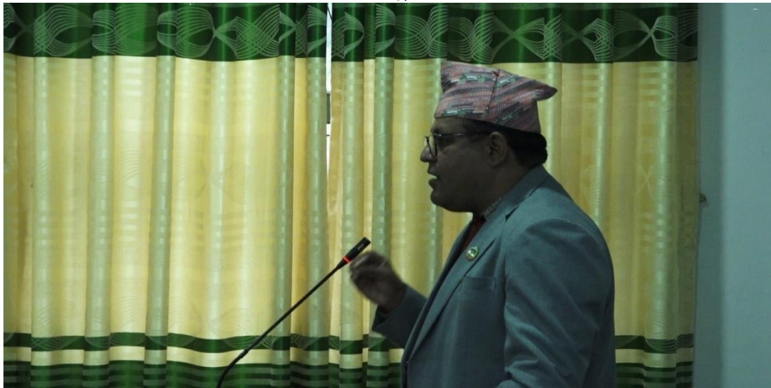
सार्वजनिक लेखा समितिका सभापतिज्यू मन्तव्य दिने क्रममा